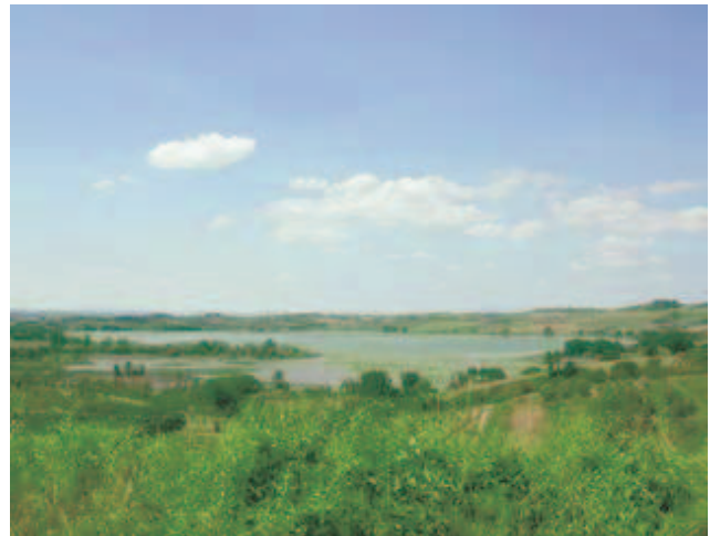
Lago di Chiusi